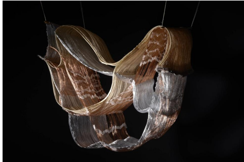
Lissajous Figur Textilskulptur, industriell gewebt