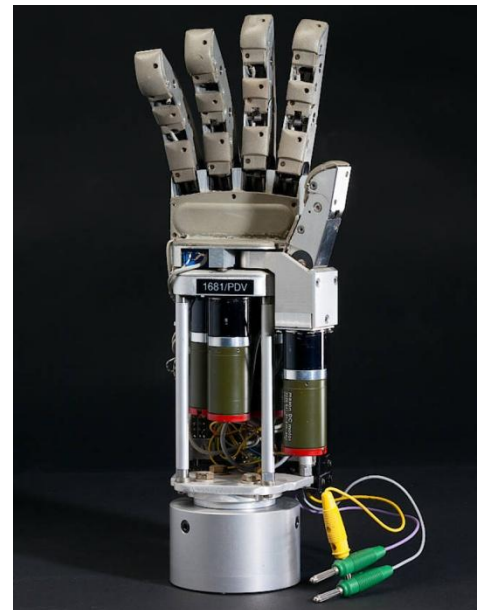
Belgrad-Hand Robotergreifer, 1980er Jahre