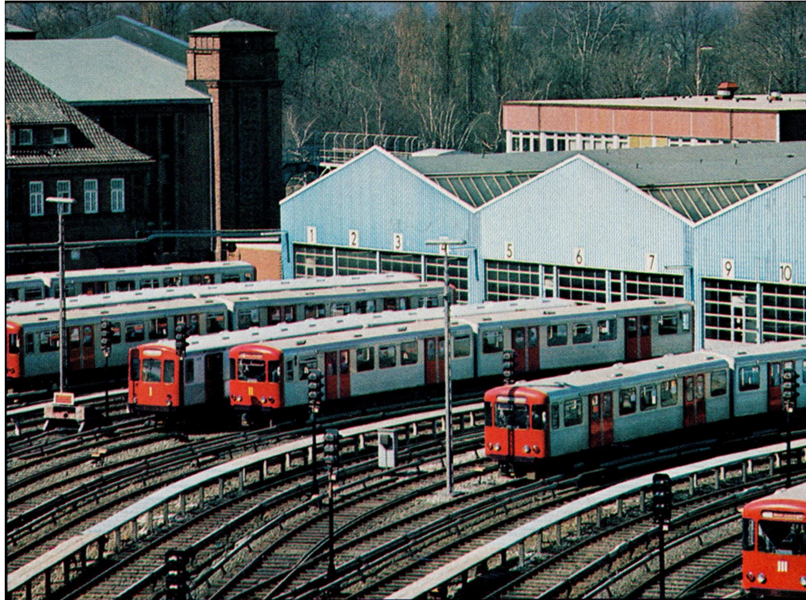
Hochschule für Gestaltung Ulm: U-Bahn-Design: Fahrzeug-Baureihe der Hamburger U-Bahn (Hans Gugelot/Herbert Lindinger/Helmut Müller-Kühn Farbkonzept: Otl Aicher)