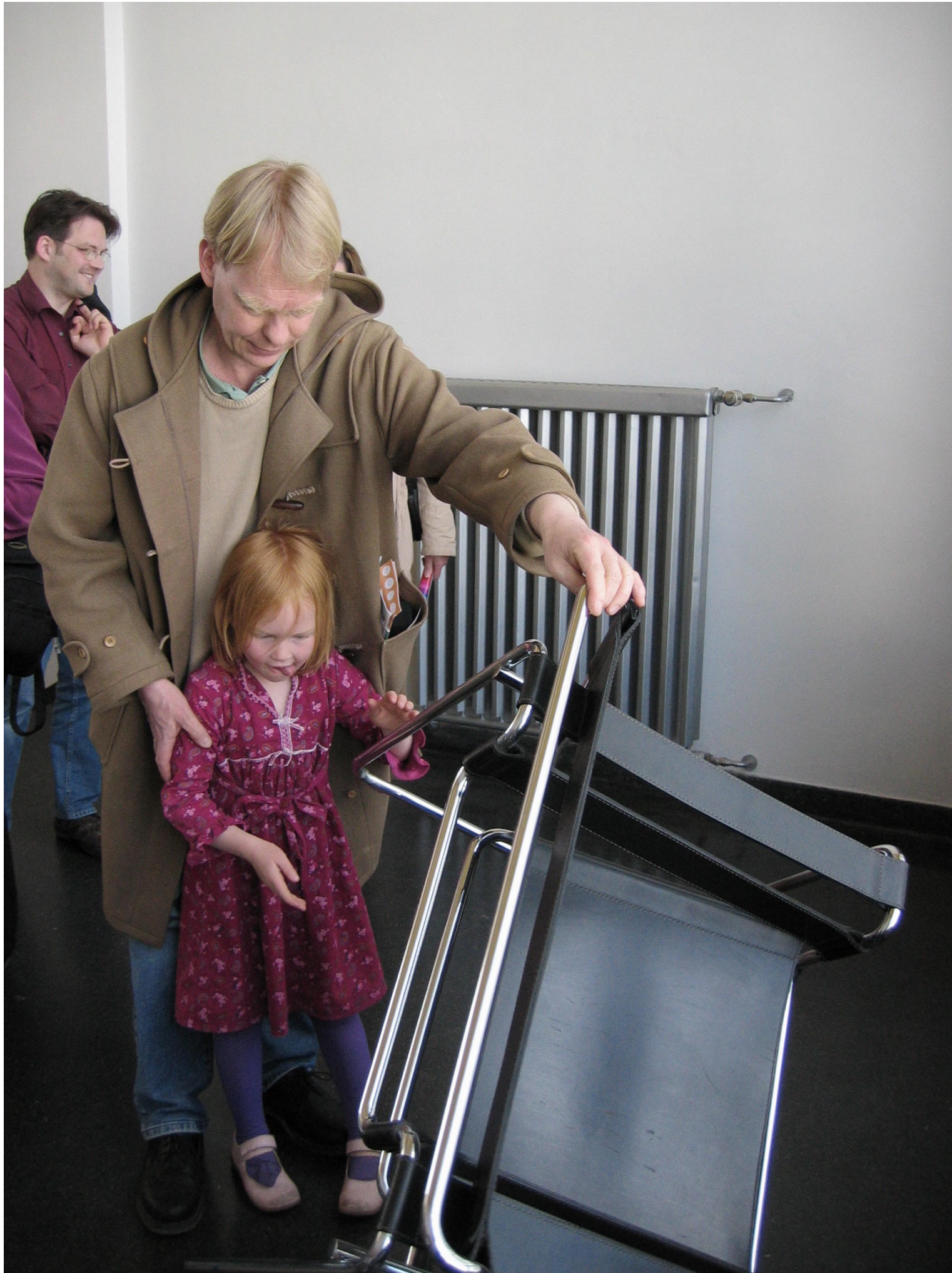
Bauhaus Möbeldesign: Wassily-Sessel (B3)