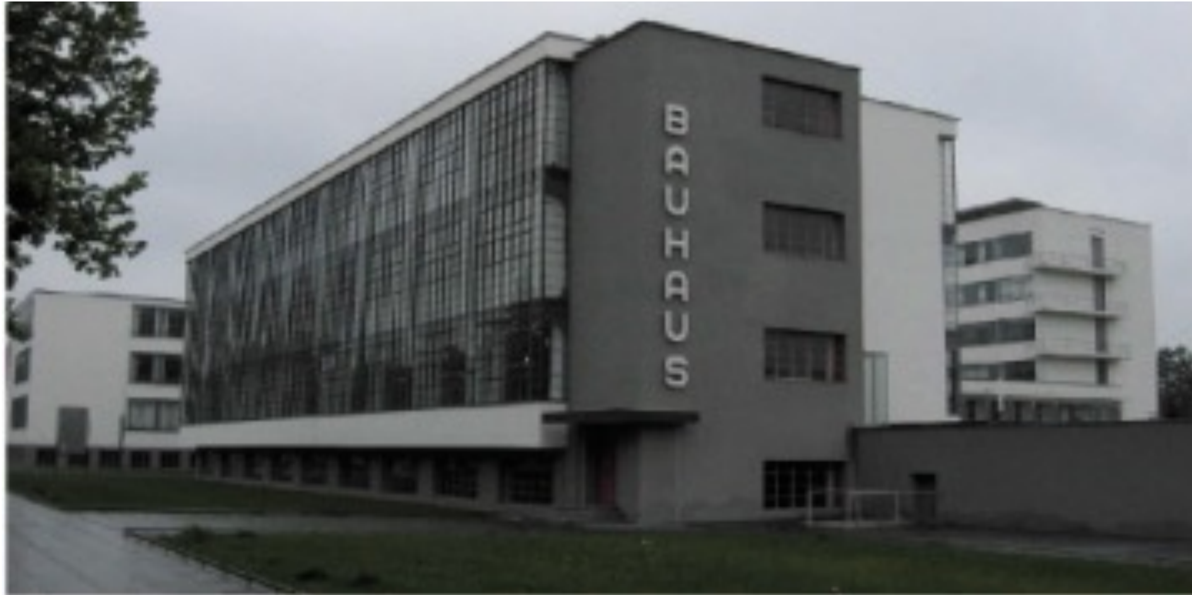
Bauhaus Architektur: Bauhaus-Gebäude in Dessau