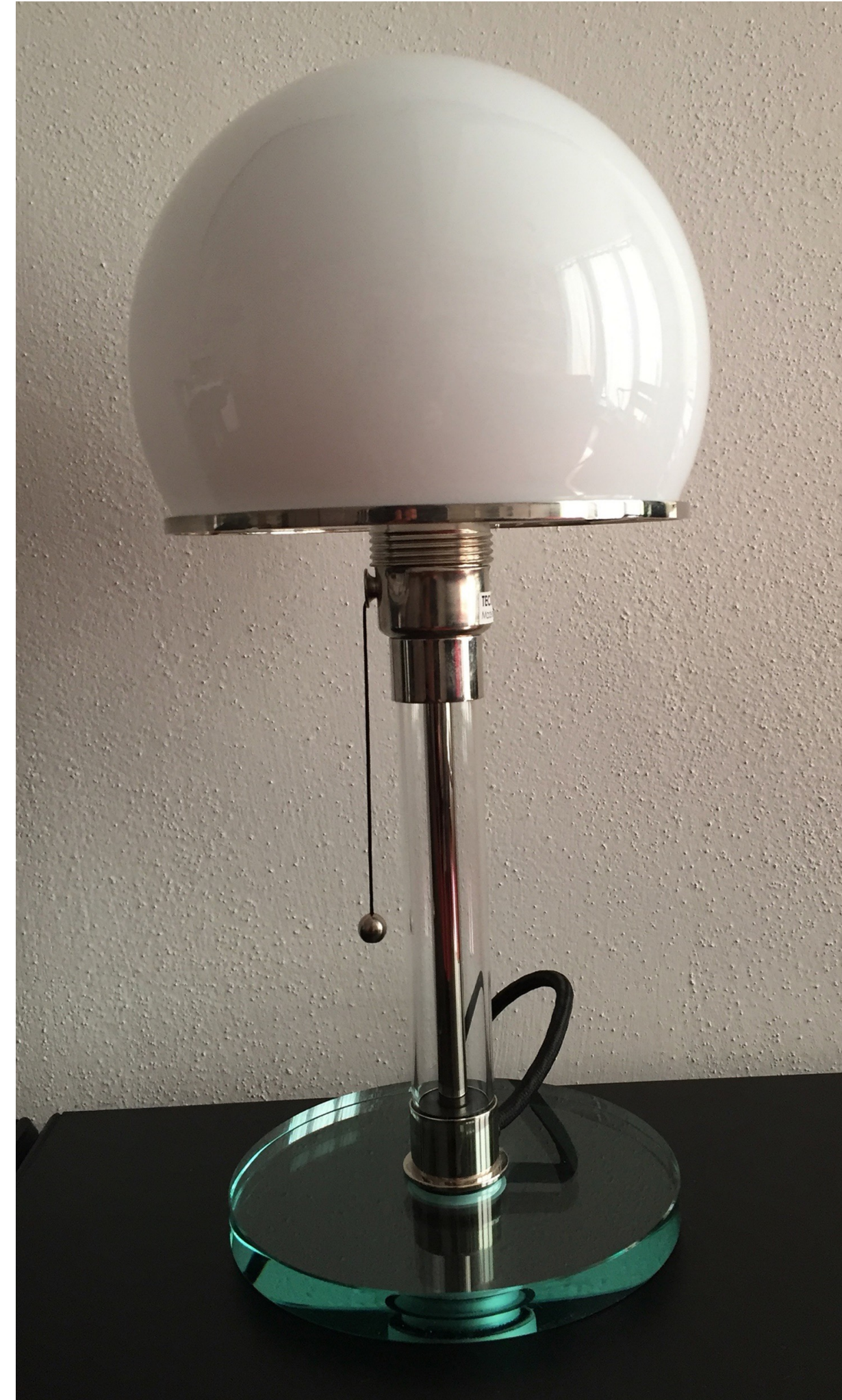
Bauhaus Produktdesign: Wagenfeld-Lampe