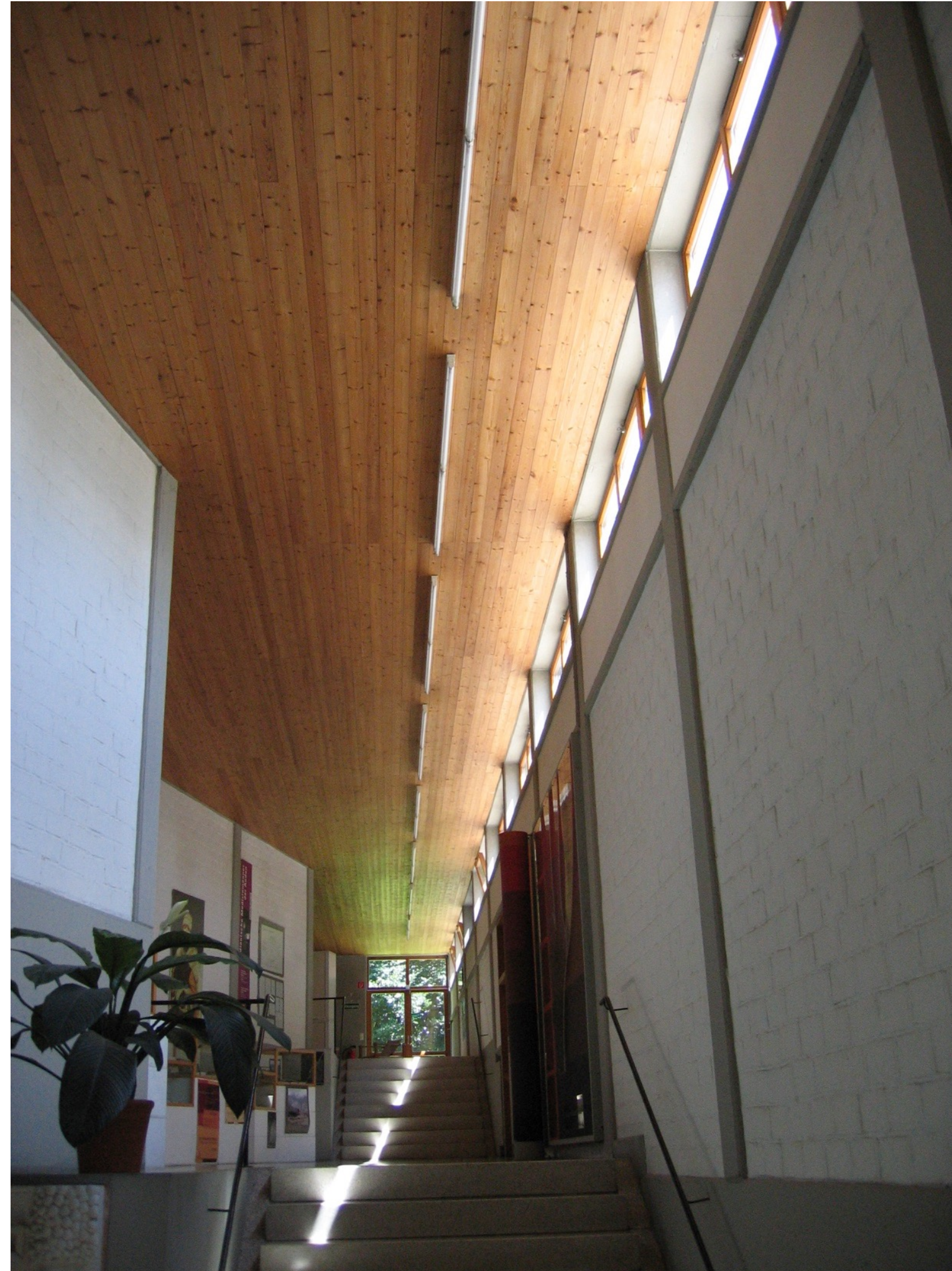
Hochschule für Gestaltung Ulm Architektur (2): Hochschulgebäude in Ulm