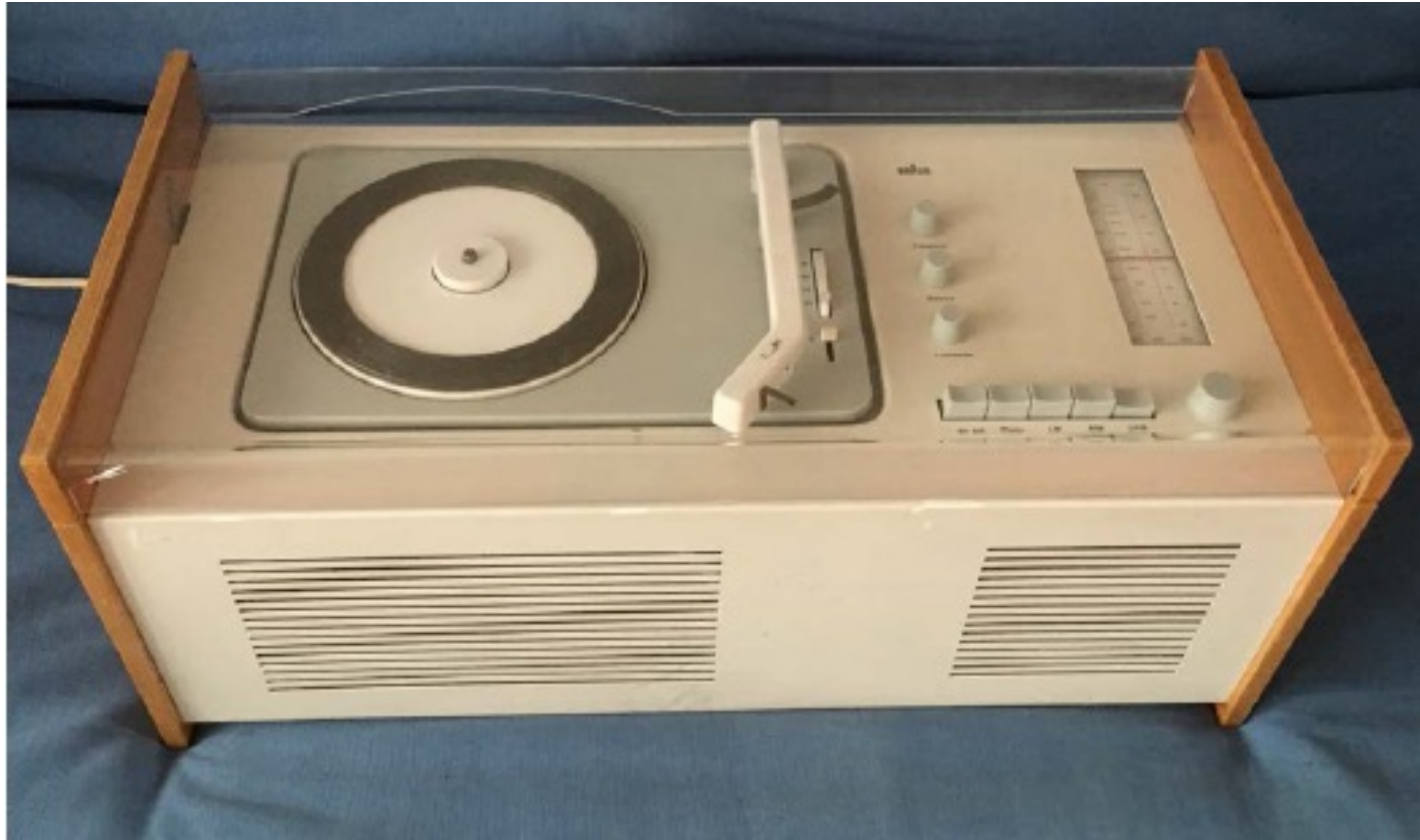
Firma Braun (6): SK 4: „Schneewittchensarg“: (Quelle: Eigene)