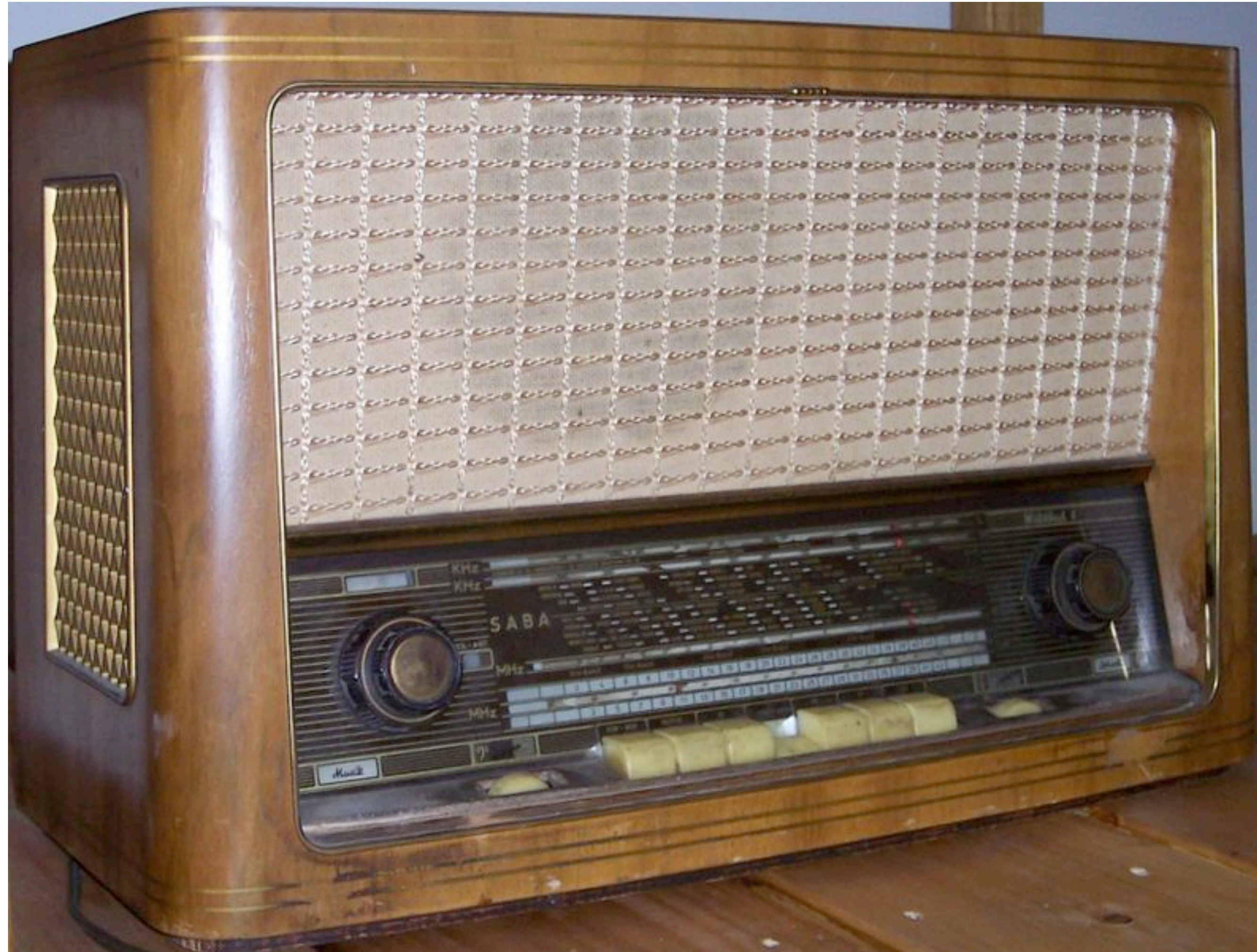
Firma Braun: Braun-Design: Nicht mehr so: