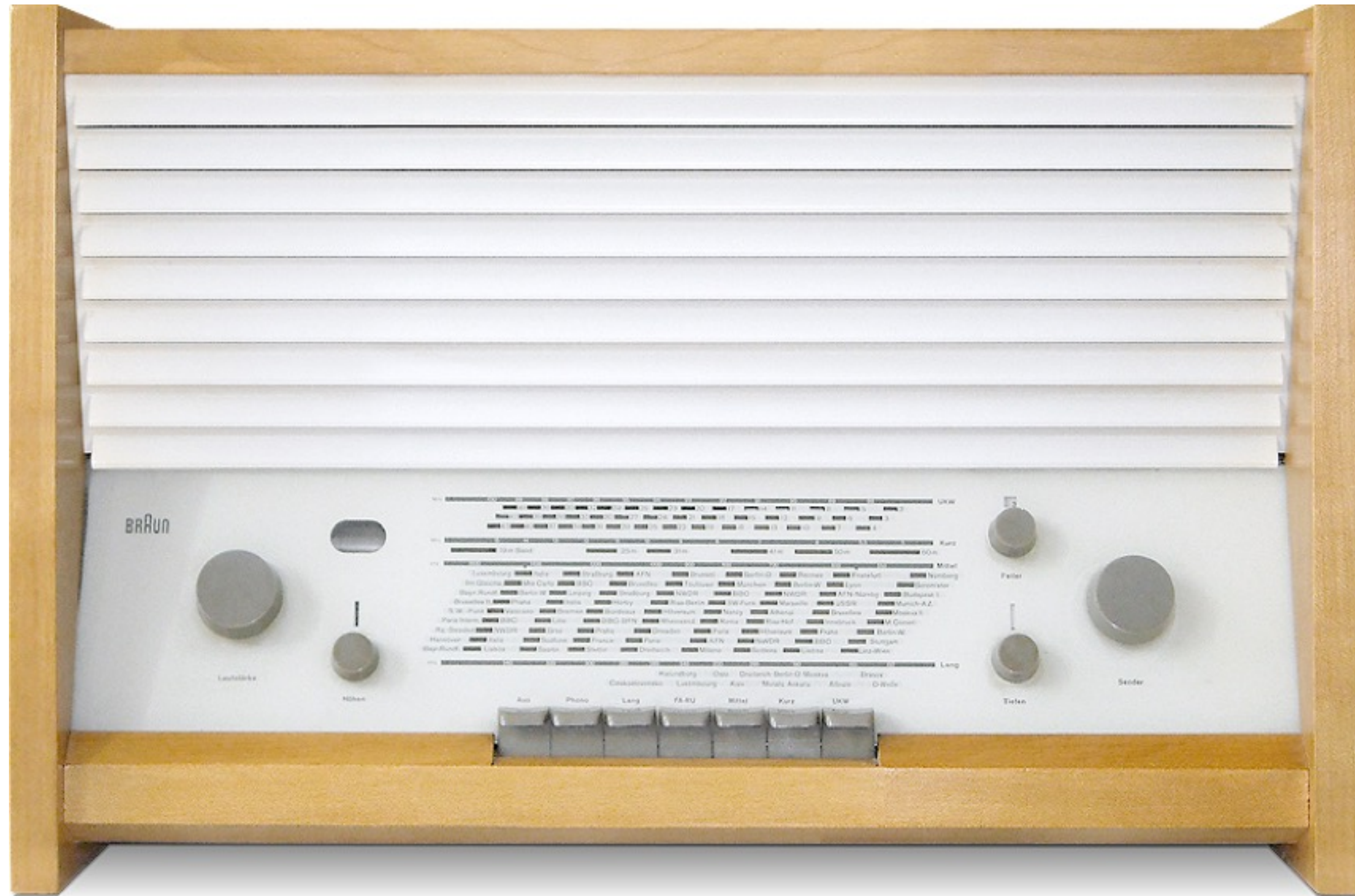
Firma Braun (5): Braun-Design: Sondern so: