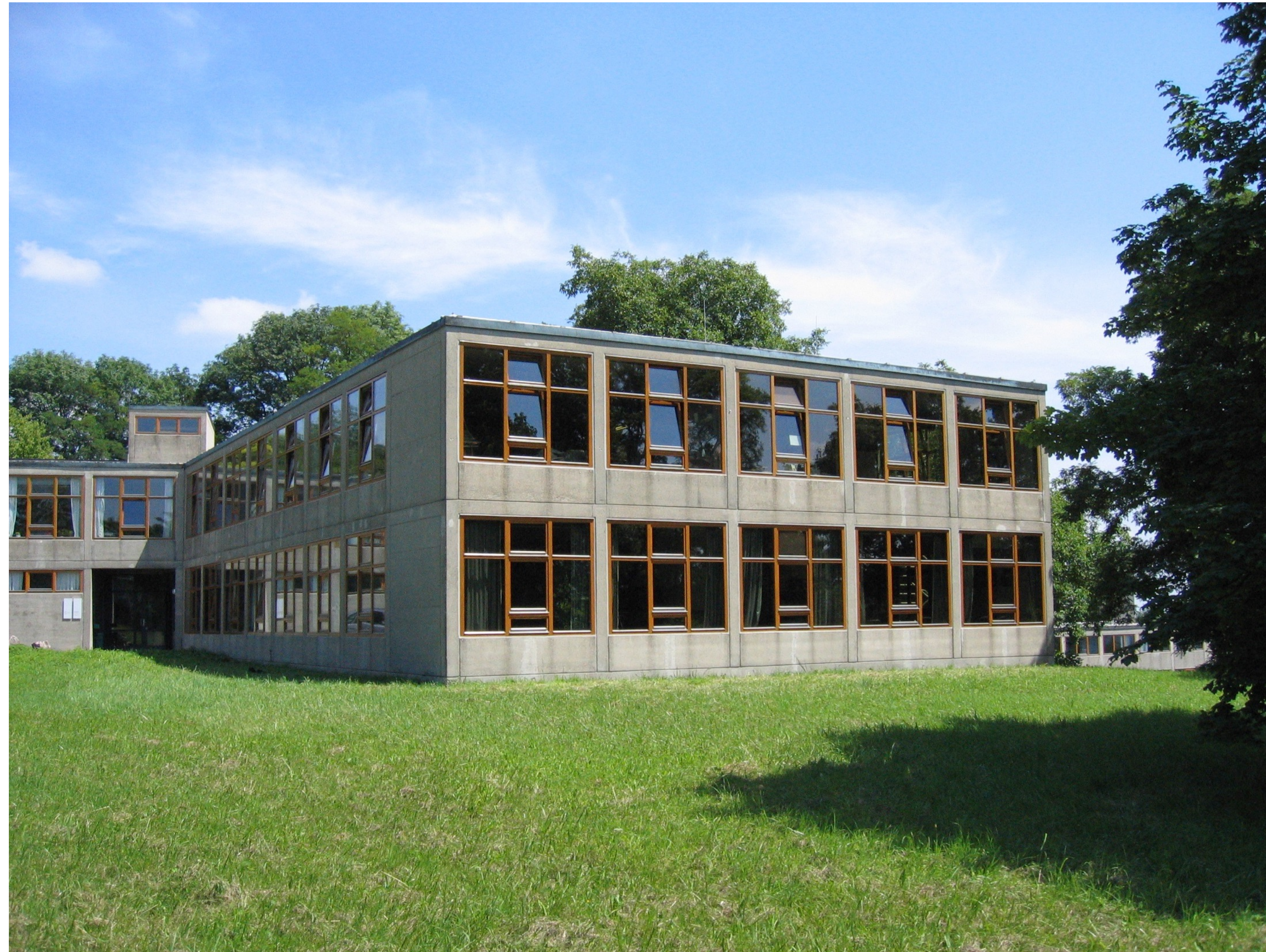
Hochschule für Gestaltung Ulm Architektur (1): Hochschulgebäude in Ulm