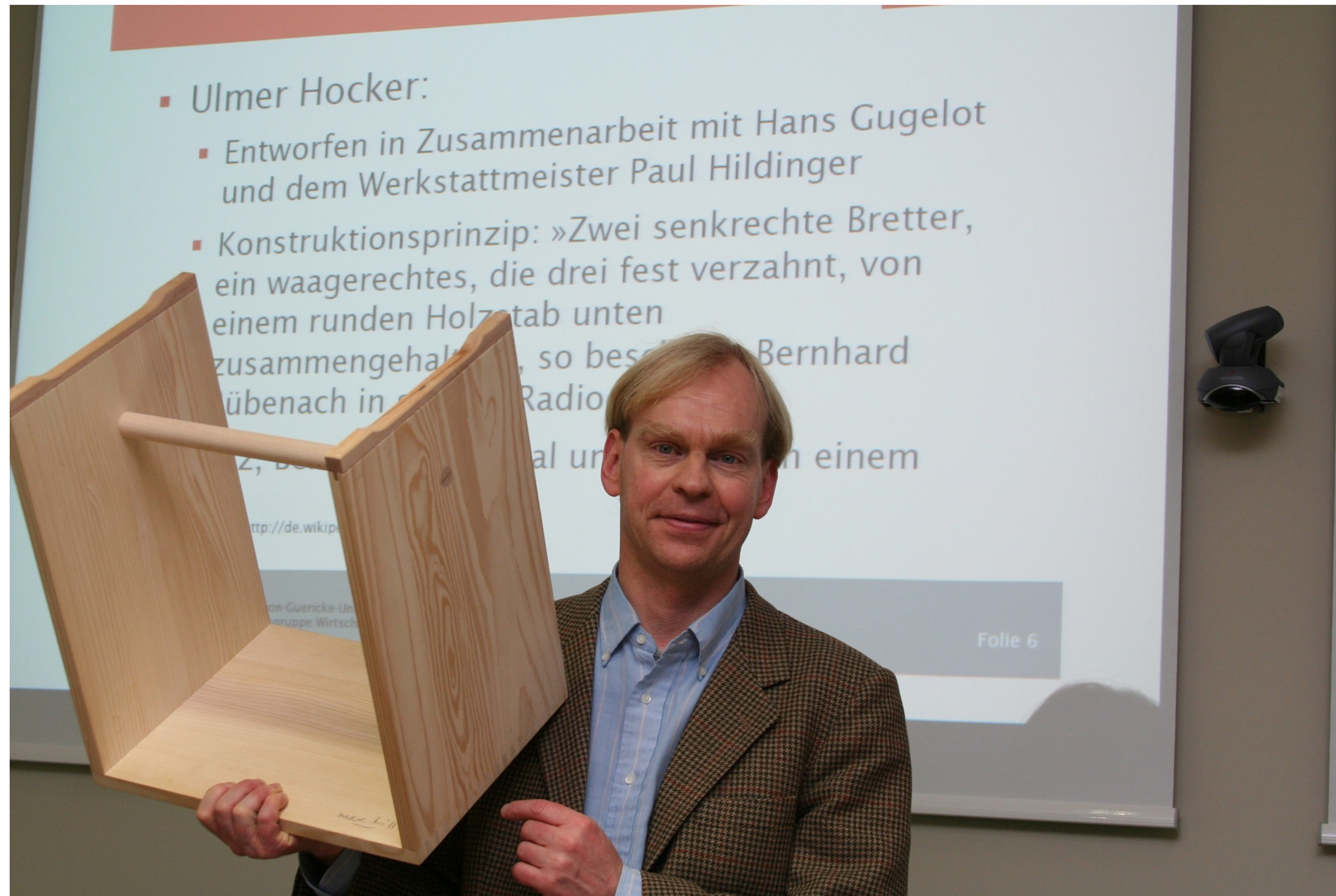
Hochschule für Gestaltung Ulm: Ulmer Hocker (Max Bill/Hans Gugelot)