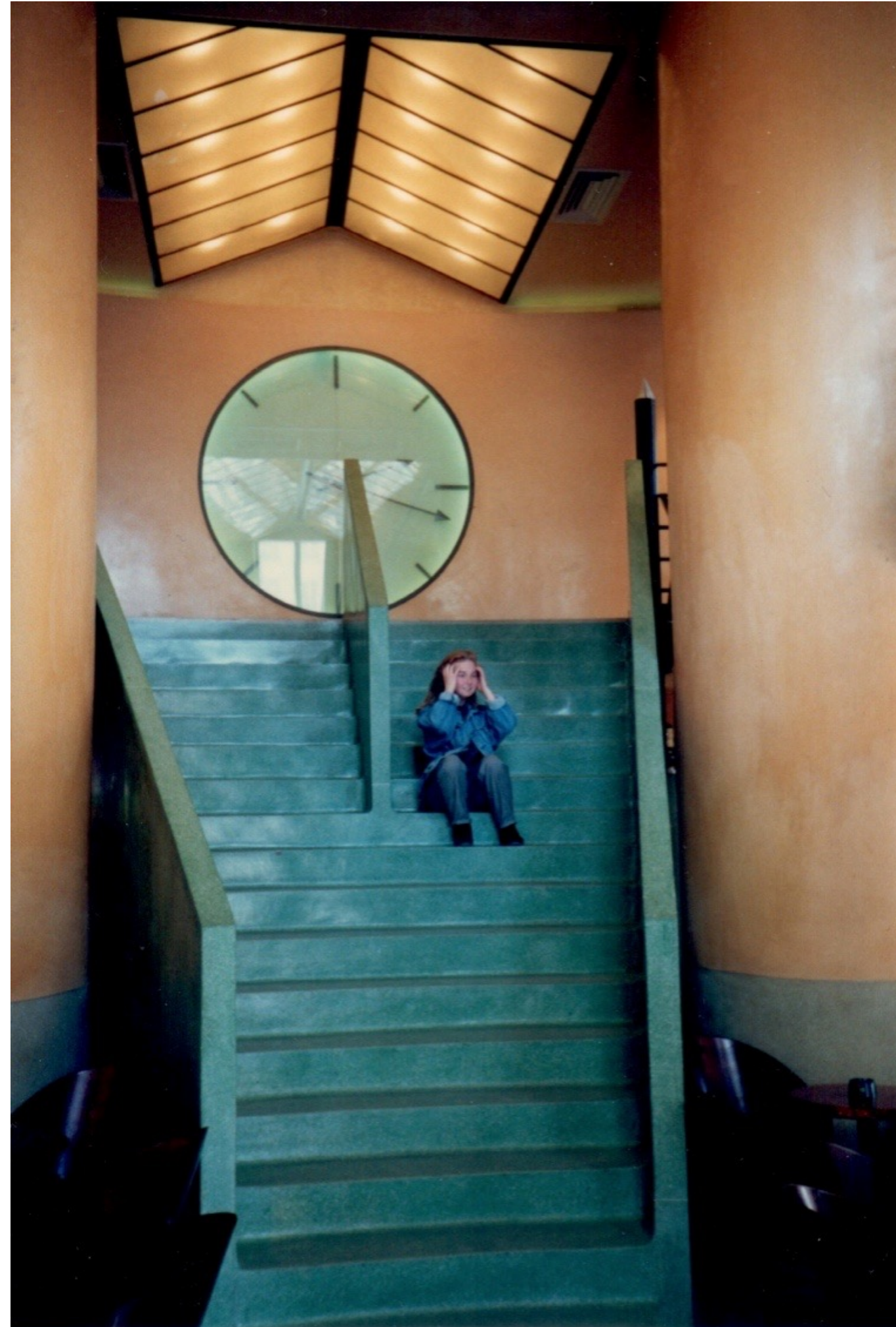
Kultcafé Café Costes (Paris 1984 – 1994): (Quelle: Eigene)