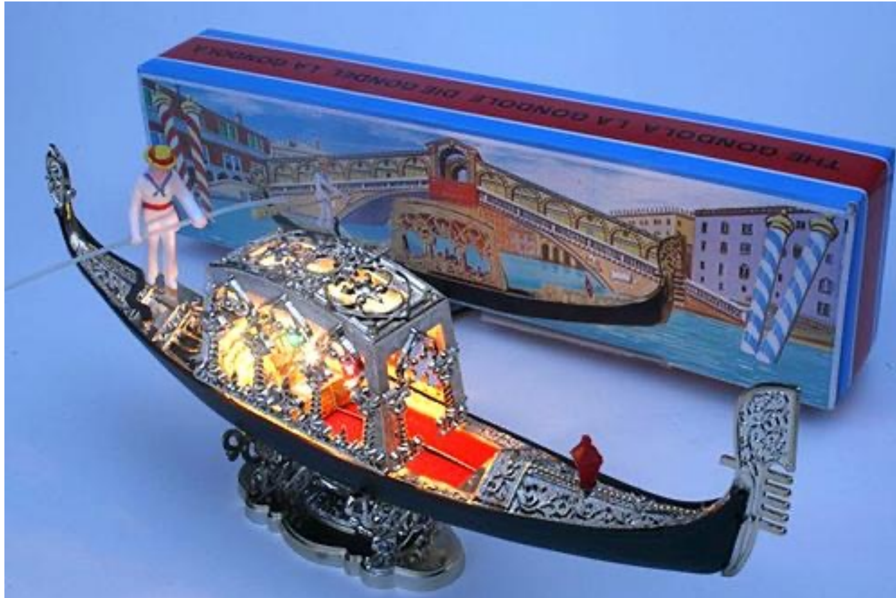
Fernsehleuchte „Gondel“